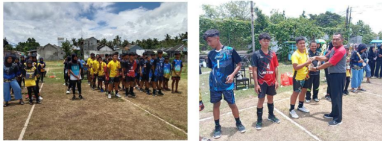
Gambar 2. Upacara dan Pembagian Hadiah Oleh Bapak Koordinator.

Dari tabel diatas dapat diketahui bahwa untuk tim putra juara 1 diraih oleh tim KKM 01, juara 2 diraih oleh tim MTsN 02, kemudian juara 3 bersama diraih oleh tim MTsN 06 dan MTsN 11. Untuk tim putri juara 1 diraih oleh tim KKM 04, juara 2 diraih oleh tim MTsN 06, kemudian juara 3 bersama diraih oleh tim KKM 02 dan MTsN 11.