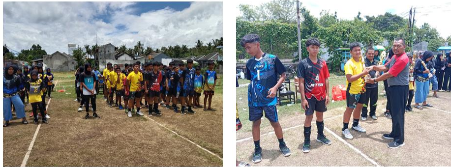
Gambar 2. Upacara dan Pembagian Hadiah Oleh Bapak Koordinator.

Dari tabel diatas dapat diketahui bahwa untuk tim putra juara 1 diraih oleh tim KKM 01, juara 2 diraih oleh tim MTsN 02, kemudian juara 3 bersama diraih oleh tim MTsN 06 dan MTsN 11. Untuk tim putri juara 1 diraih oleh tim KKM 04, juara 2 diraih oleh tim MTsN 06, kemudian juara 3 bersama diraih oleh tim KKM 02 dan MTsN 11.