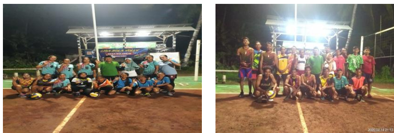
Gambar 4. Tim Putra dan Putri Desa Bulurejo

Menjadi pemain bolavoli profesional harus mampu menguasai teknik dasar dengan baik. Beberapa teknik dasar bolavoli yang harus dikuasai yaitu servis, pasing, pukulan, dan bendungan. Dalam usaha untuk mencapai suatu keberhasilan dalam mencapai prestasi yang optimal ada beberapa faktor yang menentukan antara lain faktor Kondisi Fisik atau Tingkat kesegaran jasmani, faktor kemampuan teknik dan ketrampilan yang dimilikinya (Setyawan AR, 2011). Komponen kondisi fisik terdiri dari kekuatan, daya tahan, kecepatan, kelenturan, kelincahan dan koordinasi (Bachtiar Y, 2019).