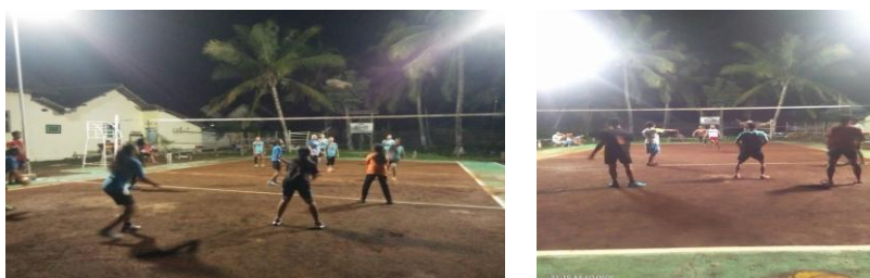
Gambar 2. Pertandingan Tim Putra dan Putri

Pelaksanaan kejuaraan bolavoli antar dusun se Desa Bulurejo Kecamatan Purwoharjo Kabupaten Banyuwangi berjalan dengan lancar. Ada enam pertandingan yang terlaksana, tiga pertandingan tim putri dan tiga pertandingan tim putra.