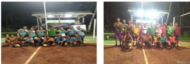
Gambar 4. Tim Putra dan Putri Desa Bulurejo

Menjadi pemain bolavoli profesional harus mampu menguasai teknik dasar dengan baik. Beberapa teknik dasar bolavoli yang harus dikuasai yaitu servis, pasing, pukulan, dan bendungan. Dalam usaha untuk mencapai suatu keberhasilan dalam mencapai prestasi yang optimal ada beberapa faktor yang menentukan antara lain faktor Kondisi Fisik atau Tingkat kesegaran jasmani, faktor kemampuan teknik dan ketrampilan yang dimilikinya (Setyawan AR, 2011). Komponen kondisi fisik terdiri dari kekuatan, daya tahan, kecepatan, kelenturan, kelincahan dan koordinasi (Bachtiar Y, 2019).