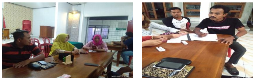
Gambar 1. Musyawarah Pembentukan Panitia

Sebelum kejuaraan bolavoli dilaksanakan dilakukan musyawarah pebentukan tim panitia dan tim seleksi yang dipimpin oleh Bapak Kepala Desa.