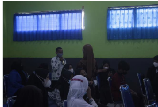
Gambar 2. Sesi tanya jawab oleh siswa SMK Gajah Mada Banyuwangi kepada Dosen Universitas PGRI Banyuwangi

beasiswa Kartu Indonesia Pintar Kuliah (KIP-Kuliah). Selain itu juga dijelaskan persyaratan apa saja yang harus disiapkan ketika ingin mendaftar menjadi calon mahasiswa di Universitas PGRI Banyuwangi. Setelah pemaparan materi dan penambahan beberapa informasi tentang beasiswa, maka kegiatan selanjutnya yaitu tanya jawab, dimana para siswa diberi kesempatan untuk menanyakan segala sesuatu terkait informasi tentang pendidikan tinggi yang ada di Indonesia. Pada sesi tanya jawab ini, terdapat 10 pertanyaan dari beberapa siswa yang berasal dari berbagai jurusan. Antusiasme siswa dalam memberikan pertanyaan tersebut disebabkan karena tema yang dipaparkan sangat sesuai dengan kebutuhan siswa kelas XII yang akan melanjutkan ke jenjang pendidikan tinggi.