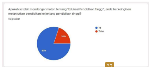
Gambar 5. Diagram antusiasme siswa untuk melanjutkan pendidikan ke jenjang pendidikan tinggi

Ketiga, para siswa memiliki antusias untuk melanjutkan pendidikan ke jenjang berikutnya, hal ini dapat dilihat dari diagram lingkaran pada Gambar 5 bahwa dengan pertanyaan “Apakah setelah mendengar materi tentang Edukasi Pendidikan Tinggi, anda berkeinginan melanjutkan Pendidikan ke jenjang Pendidikan Tinggi?”, 80% siswa menjawab “Ya”.