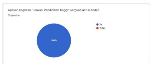
Gambar 4. Diagram antusiasme siswa terhadap kegiatan sosialisasi

Kedua, para siswa sangat antusias dalam mengikuti setiap kegiatan dalam sosialisasi ini, hal ini dapat dilihat dari diagram lingkaran pada Gambar 4 bahwa dengan pertanyaan “Apakah kegiatan Edukasi Pendidikan Tinggi berguna untuk anda?”, 100% siswa menjawab “Ya”.