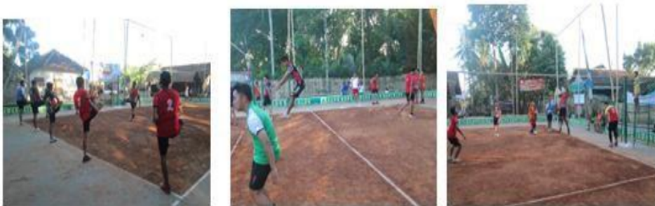
Gambar 1. Proses Latihan

Dari hasil diskusi dengan pembina dan para atlet serta pengamatan, maka disusunlah program latihan sesuai dengan kebutuhan club Gloria Muda yaitu latihan passing , latihan smash , dan kondisi fisik (tinggi lompatan) tersaji pada gambar 1 dibawah ini. .