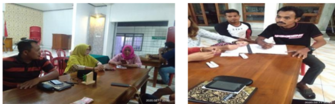
Gambar 1. Musyawarah Pembentukan Panitia

Sebelum kejuaraan bolavoli dilaksanakan dilakukan musyawarah pebentukan tim panitia dan tim seleksi yang dipimpin oleh Bapak Kepala Desa.