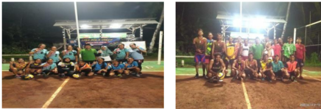
Gambar 4. Tim Putra dan Putri Desa Bulurejo

Menjadi pemain bolavoli profesional harus mampu menguasai teknik dasar dengan baik. Beberapa teknik dasar bolavoli yang harus dikuasai yaitu servis, pasing, pukulan, dan bendungan. Dalam usaha untuk mencapai suatu keberhasilan dalam mencapai prestasi yang optimal ada beberapa faktor yang menentukan antara lain faktor Kondisi Fisik atau Tingkat kesegaran jasmani, faktor kemampuan teknik dan ketrampilan yang dimilikinya (Setyawan AR, 2011). Komponen kondisi fisik terdiri dari kekuatan, daya tahan, kecepatan, kelenturan, kelincahan dan koordinasi (Bachtiar Y, 2019).