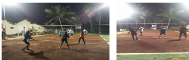
Gambar 2. Pertandingan Tim Putra dan Putri

Pelaksanaan kejuaraan bolavoli antar dusun se Desa Bulurejo Kecamatan Purwoharjo Kabupaten Banyuwangi berjalan dengan lancar. Ada enam pertandingan yang terlaksana, tiga pertandingan tim putri dan tiga pertandingan tim putra.