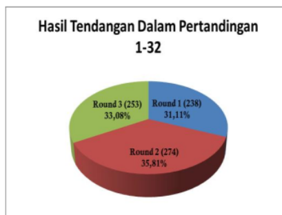
Gambar 3. Hasil Tendangan dalam Pertandingan 1-32

Dari hasil perhitungan statistik didapat hasil teknik serangan pencak silat kategori tanding yaitu tendangan pada pertandingan ke 1-32 pada round ke 1 presentase sebesar 31,11%, pada round ke 2 presentase sebesar 35,81%, dan pada round ke 3 sebesar 33,08%. Dari tabel diatas bisa dilihat bahwa dalam pertandingan Day 2-Mat B-Belgian Open 2019 Pencak Silat serangan tendangan banyak terjadi pada round ke 2 sebesar 274 kali tendangan.