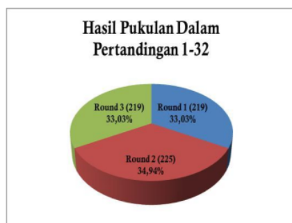
Gambar 2. Hasil Pukulan dalam Pertandingan 1-32

Dari hasil perhitungan statistik didapat hasil teknik serangan pencak silat kategori tanding yaitu pukulan pada pertandingan ke 1-32 pada round ke 1 presentase sebesar 33,03%, pada round ke 2 presentase sebesar 34,94%, dan pada round ke 3 sebesar 33,03%. Dari tabel diatas bisa dilihat bahwa dalam pertandingan Day 2-Mat B-Belgian Open 2019 Pencak Silat serangan pukulan banyak terjadi pada round ke 2 sebesar 225 kali pukulan.