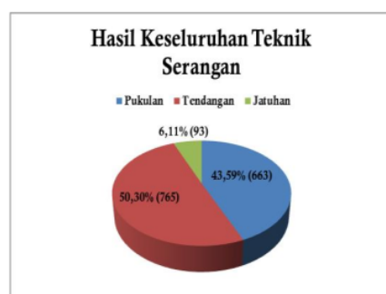
Gambar 5. Hasil Keseluruhan Teknik Serangan

Dari hasil perhitungan statistik didapat hasil teknik serangan pencak silat kategori tanding secara keseluruhan pertandingan ke 1-32 pada teknik serangan pukulan dengan presentase sebesar 43,59%, teknik serangan tendangan presentase sebesar 50,30%, dan teknik serangan jatuhnya sebesar 6,11%. Dari tabel diatas bisa dilihat bahwa dalam pertandingan Day 2-Mat B-Belgian Open 2019 Pencak Silat teknik serangan serangan yang banyak muncul adalah teknik serangan tendangan dengan 765 kali tendangan.