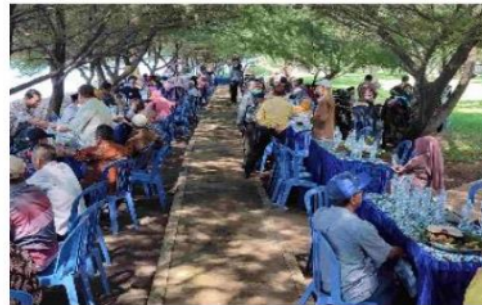
Gambar 2. Sosialisasi Sistem Barcode

yang dirancang harus mampu mengakomodasi informasi-informasi yang dibutuhkan dalam proses penginputan material yang masuk maupun yang keluar serta mampu menggantikan proses manual yang sudah berjalan sebelumnya. Oleh karena itu, informasi yang dimuat harus yang lengkap pada stiker barcode ini. Pada kegiatan ini dilakukan pemaparan cara pembuatan barcode baik melalui situs web maupun aplikasi dan cara pembuatan Kegiatan pengabdian masyarakat melalui pemanfaatan barcode sebagai media penyampai informasi paket wisata mendapat respons positif dari para wisatawan dan pengelola.