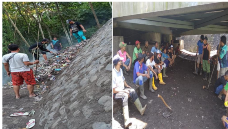
Gambar 3. proses pengaplikasian Liquid Smoke pada penghilangan bau sampah