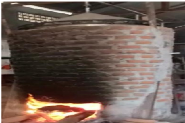
Gambar 2 Proses pembakaran tempurung kelapa menjadi Liquid Smoke