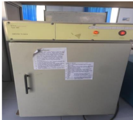
Gambar 2. Cabinet Drayer

Penerapan perlakuan panas akan mempercepat pembentukan pheofitin yang memiliki warna hijau pucat. Hal ini didukung dengan analisis statistika pada dua metode pengeringan pada Tabel 2 yang menunjukkan bahwa semua kelompok memberikan nilai signifikan p < 0,05 sehingga dapat disimpulkan