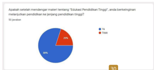
Gambar 5. Diagram antusiasme siswa untuk melanjutkan pendidikan ke jenjang pendidikan tinggi

Ketiga, para siswa memiliki antusias untuk melanjutkan pendidikan ke jenjang berikutnya, hal ini dapat dilihat dari diagram lingkaran pada Gambar 5 bahwa dengan pertanyaan “Apakah setelah mendengar materi tentang Edukasi Pendidikan Tinggi, anda berkeinginan melanjutkan pendidikan ke jenjang Pendidikan Tinggi?”, 80% siswa menjawab “Ya”.