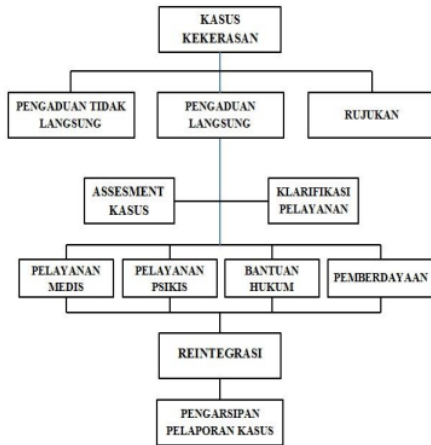
Gambar. 1 Alur Pelayanan Pengaduan

Dari pemaparan diatas penulis membuat gambaran alur pelayanan pengaduan sebagai berikut: