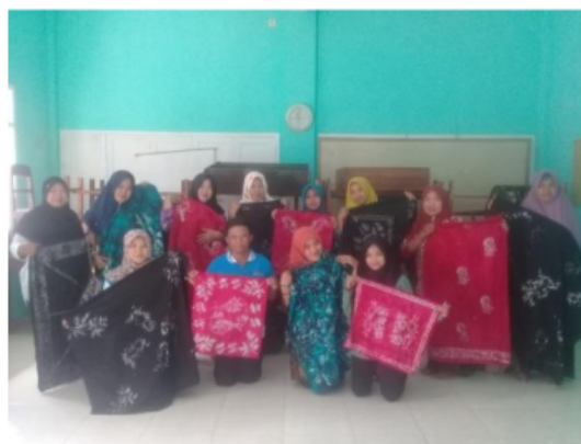
Gambar 1. Hasil Batik Dokumen Pribadi 2019

Indikator keberhasilan pelatihan ini dilihat dari respon peserta dan produk yang dihasilkan oleh peserta pelatihan. Kebermanfaatan kegiatan ini yang mengikuti pelatihan dengan tiga kategori sangat bermanfaat 87 % dan bermanfaat 23 % serta tidak bermanfaat 0%. Produk karya yang dihasilkan dapat disampaikan dengan hasil yang sangat baik dengan kuantitas dan jumlah karya batik yang didapatkan dari jumlah 11 peserta dapat menghasilkan 18 produk batik yang diselesaikan dengan sangat baik. Seperti tampak dalam gambar di bawah ini.