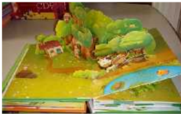
Gambar 1. Contoh POP-UP BOOK

Pop Up Book identik dengan anak-anak dan mainan, namun benda ini dapat digunakan menjadi media pembelajaran yang baik. Media ini berisi cerita bergambar yang memiliki bentuk tiga dimensi ketika halaman buku dibuka. Penggunaan media ini dalam pembelajaran dapat digunakan pada bidang kebahasaan dalam upaya menstimulus kompetensi berbahasa anak. Buku pop up merupakan media pembelajaran yang belum banyak dikenal oleh masyarakat. Penggunaan buku pop up juga dapat menambah antusiasme siswa dalam belajar. Dalam pembelajaran siswa dapat menggunakannya secara mandiri maupun digunakan secara berkelompok. Hal lain yang membuat menarik dalam buku pop up ini adalah selalu memberikan kejutan-kejutan pada setiap halamannya yang dapat memancing antusias pembaca terhadap halaman selanjutnya (Lismayati M. et al. 2016).