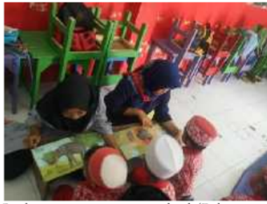
Gambar 3. penggunaan pop-up book (Dokumentasi penelitian, 2018).

Dari hasil observasi dengan instrumen kemampuan berbahasa anak pra sekolah, didapatkan kemampuan berbahasa sebelum dan sesudah penggunaan treatment Pop-Up Book sebagai berikut: