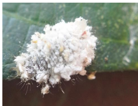
Gambar 2. Paracoccus marginatus stage dewasa

data dan pengamatan di lapangan hanya ditemukan satu predator dari kutu putih yaitu Lacewing dari spesies Hemerobius spp. Keberadaan musuh alami hama kutu putih ini diduga dipengaruhi oleh keanekaragaman hama kutu putih sebagai inang, keberadaan tanaman liar sebagai tempat berlindung dan sumber makanan alternatif bagi musuh alami tersebut. Beberapa predator lain dari kutu putih yang dapat mengendalikan pertumbuhan populasi hama kutu putih antara lain Hyperaspis notata Mulsant dan H. jucundan (Coleoptera: Coccinellidae) [22]. Tidak adanya musuh alami kutu putih yang berupa parasitoid disebabkan karena hama kutu putih sebagai inang dari parasitoid tersebut merupakan hewan eksotis yang bukan asli Indonesia. Sehingga musuh alaminya juga tidak dapat ditemukan secara alami di Indonesia. Hama kutu putih yang di- rearing tidak terparasit, sehingga tidak ada parasitoid yang muncul setelah proses rearing dilakukan. Upaya pengendalian hayati yang mulai diterapkan adalah dengan pelepasan parasitoid Anagyrus lopezi sebagai musuh alami dari hama kutu putih.