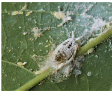
Gambar 1. Ferrisia virgata stage dewasa

diawali dengan munculnya gejala keriput pada bagian tanaman. Bagian tanaman yang terkena serangan akan berangsur menjadi kering dan mengalami keguguran daun [20].