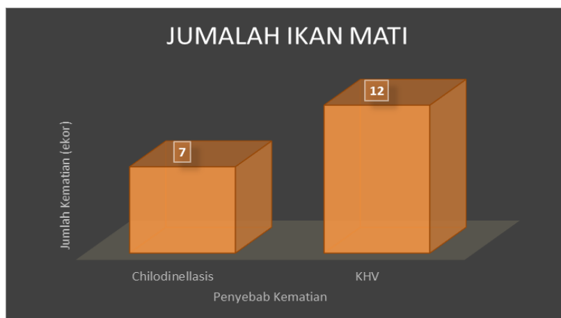
Gambar 2. Tingkat kematian ikan pada kasus Chilodinellasis dan Koi Herpes Virus (KHV) selama 14 hari

pelepasan lender yang berlebihan, serta diikuti dengan pendarahan pada organ internal ikan (Sarjito et al., 2013; Sumiati & Sunarto, 2012). Berdasarkan data parameter pengamatan secara klinis kasus dengan parameter ikan yang sakit belum dapat membedakan resiko penularan masing-masing kasus Chilodinellasis atau KHV. Namun berdasarkan identifikasi tingkat kematian seluruhnya ikan hingga 63,33%, dengan identifikasi lanjut pada insang ikan yang mati dari 19 ekor didapatkan kematian ikan akibat KHV sebesar 12 ekor dan kecenderungan kasus Chilodinellasis sebanyak 7 ekor. Data dapat dilihat pada Gambar 2, berikut ini.