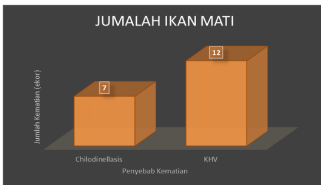
Gambar 2. Tingkat kematian ikan pada kasus Chilodinellasis dan Koi Herpes Virus (KHV) selama 14 hari

pelepasan lender yang berlebihan, serta diikuti dengan pendarahan pada organ internal ikan (Sarjito et al., 2013; Sumiati & Sunarto, 2012). Berdasarkan data parameter pengamatan secara klinis kasus dengan parameter ikan yang sakit belum dapat membedakan resiko penularan masing-masing kasus Chilodinellasis atau KHV. Namun berdasarkan identifikasi tingkat kematian seluruhnya ikan hingga 63,33%, dengan identifikasi lanjut pada insang ikan yang mati dari 19 ekor didapatkan kematian ikan akibat KHV sebesar 12 ekor dan kecenderungan kasus Chilodinellasis sebanyak 7 ekor. Data dapat dilihat pada Gambar 2, berikut ini.