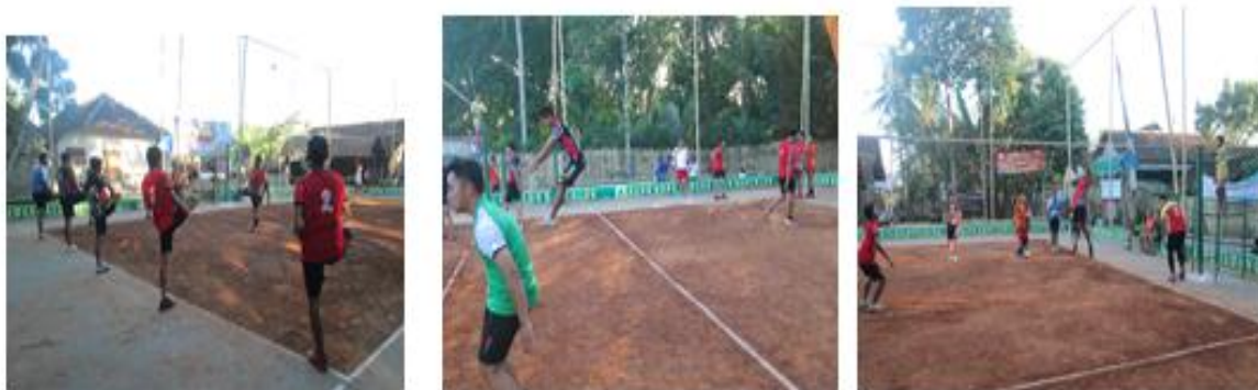
Gambar 1. Proses Latihan

Dari hasil diskusi dengan pembina dan para atlet serta pengamatan, maka disusunlah program latihan sesuai dengan kebutuhan club Gloria Muda yaitu latihan passing , latihan smash , dan kondisi fisik (tinggi lompatan) tersaji pada gambar 1 dibawah ini. .