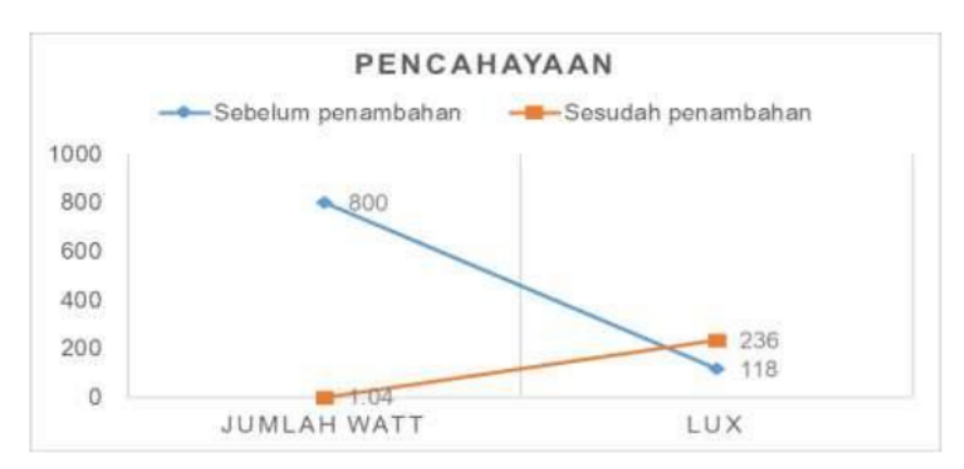
Gambar 2. Pencahayaan.

Dari tabel diatas dapat diketahui bahwa dari hasil penambahan ini cahaya lampu yang pada awalnya dengan 800-watt ditambah menjadi 1040-watt. Intensitas cahaya yang pada mulanya sebesar 118 Lux menjadi 236 Lux. Berikut data disajikan dalam bentuk grafik: