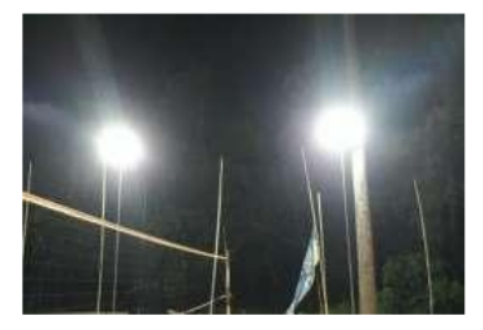
Gambar 1. Sebelum dan Sesudah

Dua lampu ditambahkan disebelah kiri tiang net dan dua lampu ditambahkan disebelah kanan tiang net yang saling berhadapan. Berikut jumlah daya disajikan dalam bnetuk tabel: