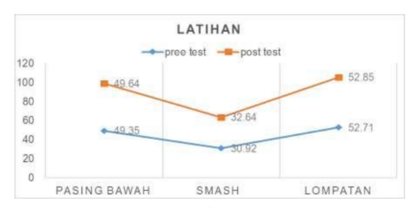
Gambar 3. Grafik Nilai Latihan

Dari tabel diatas dapat diketahui bahwa secara rata-rata penilaian hasil latihan untuk pree test pasing bawah sebesar 49,35, untuk smash sebesar 30, 92, dan untuk lompatan sebesar 52,71. Untuk post test pasing bawah sebesar 49,64, untuk smash sebesar 32,64, dan untuk lompatan sebesar 52,85. Berikut data disajikan dalam bentuk grafik.