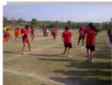
Gambar 1 Permainan Hadang atau Gobak Sodor (Hanief & Sugito, 2015)

Menurut Kylasov (2015) menyatakan ethnosport merupakan sebuah teori baru tentang olahraga yang disajikan dalam bentuk keragaman budaya ( ethno ) melalui pengembangan gaya tradisional aktivitas fisik. Saat ini banyak penelitian yang menggunakan permainan tradisional sebagai media dalam meningkatkan keterampilan dasar anak (Setiawan & Santoso, 2019). Seperti halnya permainan tradisional gobak sodor sebagai media dalam meningkatkan kemampuan gerak motorik kasar (Lubaba & Rohita, 2014). Berdasarkan hal tersebut maka penulis ingin mengungkap komponen fisik apa yang terdapat dalam budaya permainan tradisional gobak sodor.