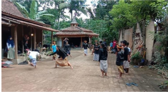
Gambar di atas menunjukkan saat seorang anak menjaga keseimbangan tubuhnya supaya tidak terjatuh setelah berhasil melakukan hindaran terhadap penghadang

Keseimbangan juga diperlukan untuk menguasai atau mengontrol semua gerak alat tubuh dan berkaitan dengan kelincahan