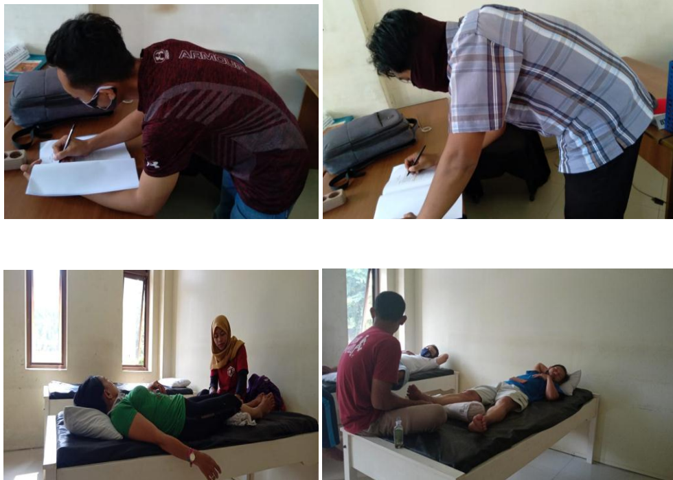
Gambar 1. Pelaksanaan Massage

warga diperbolehkan untuk istirahat lebih lama sampai kondisinya kembali prima untuk kembali melanjutkan aktivitas dalam kegiatan massage ini terdapa t30 warga yang memanfaatkan kegiatan massage tersebut. Dengan demikian antusias dari warga cukup baik terhadap kegiatan massage ditahun 2020. Berikut dokumentasi pelaksanaan kegiatan pengabdian masyarakat massage: