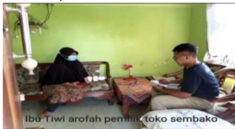
Gambar 01. Pemilik Usaha Toko Sembako sebagai Pengguna dari Toko Jaya Plastik

yang dimiliki serta pengalamannya berdagang. Bertempat di Ruko JL. Gajahmada no.186 genteng kulon , Banyuwangi. Toko plastik ini sudah memiliki banyak pelanggan. Pemilihan plastik sebagai usaha dengan pertimbangan tidak akan basi dan merupakan bahan bahan yang sangat mudah terjual. Bisnis toko plastik ini dapat dimulai dengan modal awal 60 juta. Ketika pertama kali buka, toko ini langsung didatangi banyak pelanggan. Mengenai spesifikasi produk yang dijual mulai dari bentuk bentuk plastik, ukuran, harga, material dll bahkan mereka banyak belajar dari customer mengenai bahan bahan plastik yang tidak ada di tokonya. Untuk meningkatkan pengetahuan terkait bahan bahan plastic, ukuran dan harga material dan informasi lainnya.