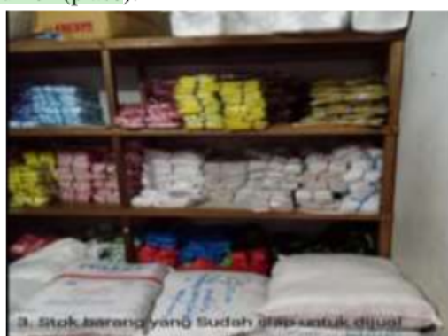
Gambar 03. Salah satu Stok Barang Yang sudah siap untuk dijual di Toko Jaya Plastik

Selama melaksanakan Magang mahasiswa belajar terkait pembukuan, Pengemasan dan strategi Pemasaran. Terkait pembukuan mahasiswa dibekali proses mem 9 at catatan harian mengenai pengeluaran dan pemasukan keuangan, pembukuan penjualan, pembukuan usaha, mengolah data mendata dan mencatat 2 masukan dan pengeluaran keuangan. Pengemasan yang didapat selama magang adalah cara-cara pengemasan dan labeling yang baik 2 an menarik tentu sangat diperlukan dalam mendukung suatu produk makanan. Kemas-an atau 2 packaging menjadi salah satu unsur penting dalam suatu produk (Kotler & Keller 2009). Pengemasan dan labeling dalam rangka memasarkan produk makanan sangat penting untuk dilakukan. Pengemasan selain berfungsi sebagai alat melindungi produk, juga meningkatkan daya tarik konsumen untuk membeli suatu produk ter 5 tu. Selain itu mahasiswa juga dibekali Strategi Pemasaran dengan dititik beratkan pada menghasilkan barang dan jasa sesuai dengan kebutuhan dan keinginan konsumen (product), menentukan tingkat harga (price), mempromosikan agar produk dikenal konsumen (promotion), dan mendistribusikan produk ke tempat konsumen (place).