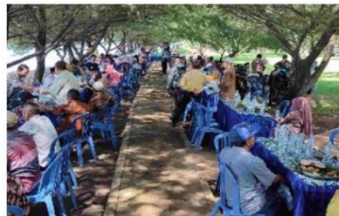
Gambar 2. Sosialisasi Sistem Barcode

yang dirancang harus mampu mengakomodasi informasi-informasi yang dibutuhkan dalam proses penginputan material yang masuk maupun yang keluar serta mampu menggantikan proses manual yang sudah berjalan sebelumnya. Oleh karena itu, informasi yang dimuat harus yang lengkap pada stiker barcode ini. Pada kegiatan ini dilakukan pemaparan cara pembuatan barcode baik melalui situs web maupun aplikasi dan cara pembuatan Kegiatan pengabdian masyarakat melalui pemanfaatan barcode sebagai media penyampai informasi paket wisata mendapat respons positif dari para wisatawan dan pengelola.