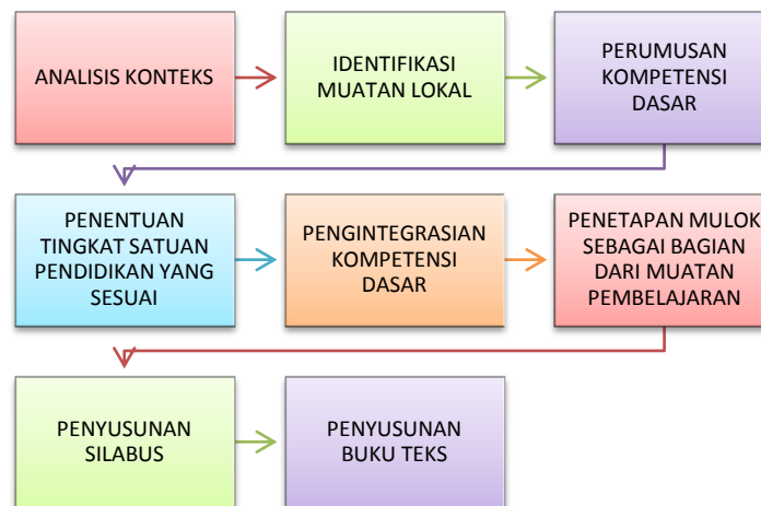
Tahapan pengembangan muatan lokal