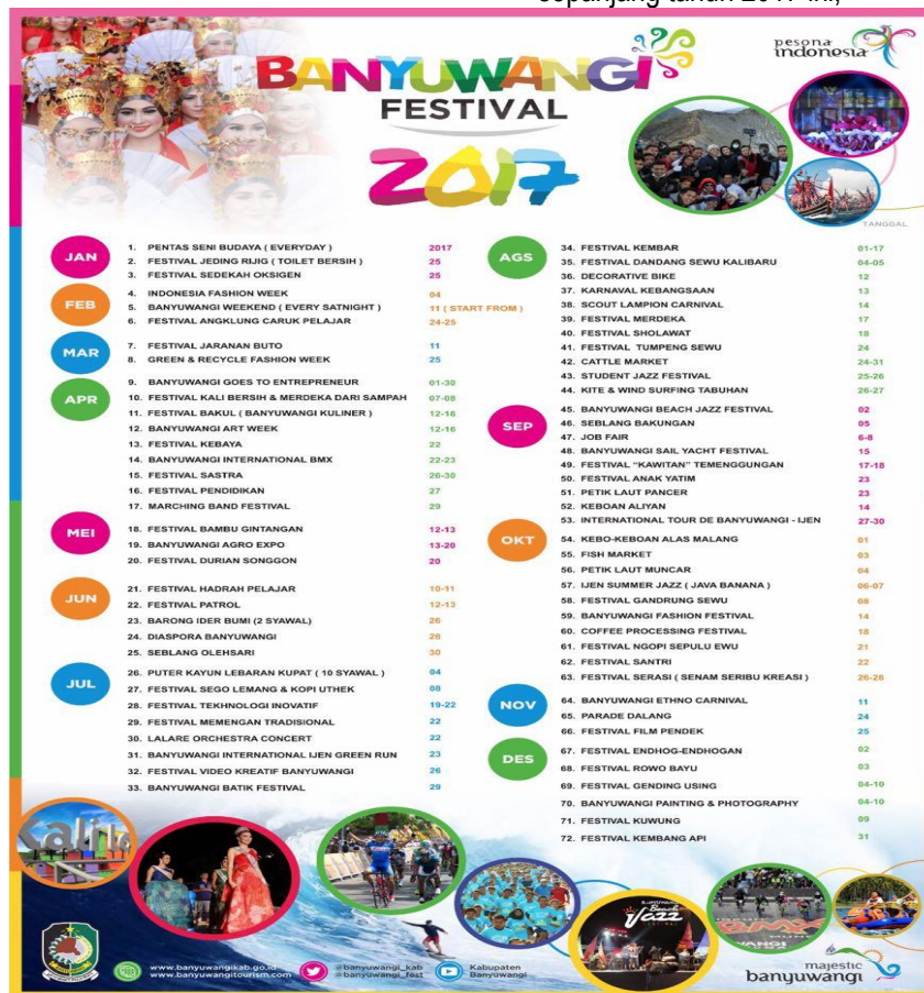
Jadwal Banyuwangi Festival (B-Fest) tahun 2017

Seperti tahun 2017 ini, selain mengagendakan event event besar yang telah menjadi ikon daerah, seperti tour de ijen, Banyuwangi Ethno Carnival, Festival Gandrung sewu, Banyuwangi Jazz Festival, serta jazz ijen juga diadakannya event baru seperti Sail Yacht Festival, dan festival bamboo. Sejumlah event yang telah diagendakan tersebut telah terjadwal sepanjang tahun 2017 ini,