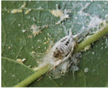
Gambar 1. Ferrisia virgata stage dewasa

diawali dengan munculnya gejala keriput pada bagian tanaman. Bagian tanaman yang terkena serangan akan berangsur menjadi kering dan mengalami keguguran daun [20].