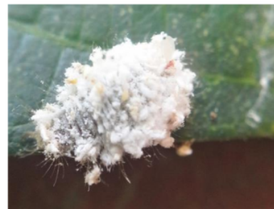
Gambar 2. Paracoccus marginatus stage dewasa

data dan pengamatan di lapangan hanya ditemukan satu predator dari kutu putih yaitu Lacewing dari spesies Hemerobius spp. Keberadaan musuh alami hama kutu putih ini diduga dipengaruhi oleh keanekaragaman hama kutu putih sebagai inang, keberadaan tanaman liar sebagai tempat berlindung dan sumber makanan alternatif bagi musuh alami tersebut. Beberapa predator lain dari kutu putih yang dapat mengendalikan pertumbuhan populasi hama kutu putih antara lain Hyperaspis notata Mulsant dan H. jucundana (Coleoptera: Coccinellidae) [22]. Tidak adanya musuh alami kutu putih yang berupa parasitoid disebabkan karena hama kutu putih sebagai inang dari parasitoid tersebut merupakan hewan eksotis yang bukan asli Indonesia. Sehingga musuh alaminya juga tidak dapat ditemukan secara alami di Indonesia. Hama kutu putih yang di- rearing tidak terparasit, sehingga tidak ada parasitoid yang muncul setelah proses rearing dilakukan. Upaya pengendalian hayati yang mulai diterapkan adalah dengan pelepasan parasitoid Anagyrus lopezi sebagai musuh alami dari hama kutu putih.