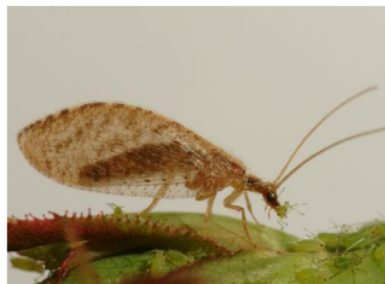
Gambar 3. Hemerobius sp. [24]

Hasil analisis. Indeks keanekaragaman kutu putih pada tanaman singkong di Kabupaten Banyuwangi hampir sama pada sepuluh lokasi penelitian, tertinggi ditemukan