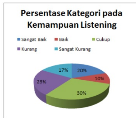
Gambar 8. Persentase Hasil Tes Listening

pada level skor 81-100 (kategori sangat baik). Selanjutnya 10% peserta (3 orang) berada pada level 71-80 (kategori baik). Kemudian 30% peserta (9 orang) berada pada level 61-70 (kategori cukup). Sebesar 23.33% peserta (7 orang) berada pada level 51-60 (kategori kurang), dan sejumlah 16.67% peserta (5 orang) berada pada level 50 < (kategori sangat kurang). Secara keseluruhan, nilai rata-rata untuk kemampuan listening adalah 70.33 pada level skor 61-70 dengan kategori cukup.