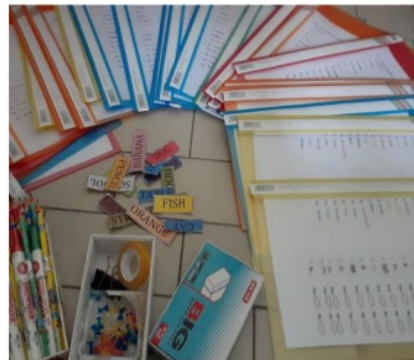
Gambar 2. Peralatan Pelatihan Bahasa Inggris

Pemberian materi diawali dengan memberikan materi atau ulasan sederhana dan kegiatan-kegiatan ringan lainnya (seperti menulis, membaca dan menirukan suara pelatih dalam Bahasa Inggris) dengan menggunakan drilling method .