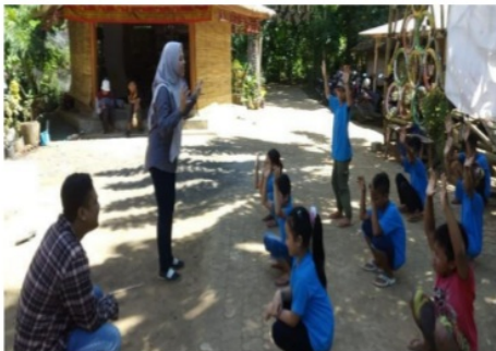
Gambar 7. Tahap Pelatihan Bahasa Inggris di luar ruangan ( outdoor )

Pada tahap awal, kegiatan dimulai dengan berdoa bersama dan peserta pelatihan mengisi daftar hadir. Tahap berikutnya adalah kegiatan inti pelatihan. Setelah pemberian materi EYL, kegiatan berikutnya adalah mengaplikasikan berbagai macam bentuk permainan kepada peserta pelatihan yang terbagi dalam beberapa bentuk kelompok. Kemudian, pada akhir kegiatan pelatihan, peserta diberi tes yang meliputi empat kemampuan berbahasa ( listening, speaking, reading and writing ). Berikut adalah data hasil tes responden setelah kegiatan pelatihan dilakukan.