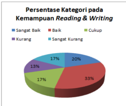
Gambar 10. Persentasi Hasil Tes Reading & Writing

Berdasarkan hasil analisa, sejumlah 20% peserta (6 orang) berada pada level skor 81-100 (kategori sangat baik). Selanjutnya 33.3% peserta (10 orang) berada pada level 71-80 (kategori baik). Kemudian 16.67% peserta (5 orang) berada pada level 61-70 (kategori cukup). Sebesar 13.33% peserta (4 orang) berada pada level 51-60 (kategori kurang), dan sejumlah 16.67% peserta (5 orang) berada pada level 50 < (kategori sangat kurang). Secara keseluruhan, nilai rata-rata untuk kemampuan reading & writing adalah 67.91 pada level skor 61-70 dengan kategori cukup.