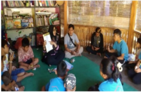
Gambar 6. Tahap Pelatihan Bahasa Inggris dalam ruangan ( indoor )

Pada tahap awal, kegiatan dimulai dengan berdoa bersama dan peserta pelatihan mengisi daftar hadir. Tahap berikutnya adalah kegiatan inti pelatihan. Setelah pemberian materi EYL, kegiatan berikutnya adalah mengaplikasikan berbagai macam bentuk permainan kepada peserta pelatihan yang terbagi dalam beberapa bentuk kelompok. Kemudian, pada akhir kegiatan pelatihan, peserta diberi tes yang meliputi empat kemampuan berbahasa ( listening, speaking, reading and writing ). Berikut adalah data hasil tes responden setelah kegiatan pelatihan dilakukan.