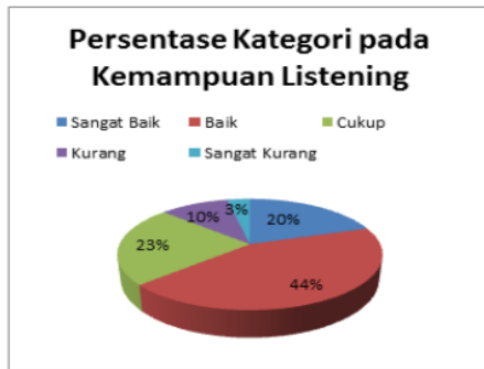
Gambar 9. Persentase Hasil Tes Speaking