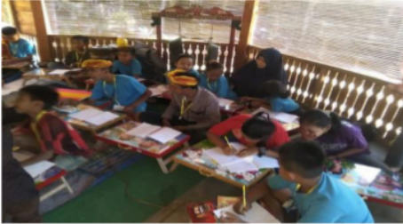
Gambar 12. Tahap Akhir Kegiatan Pelatihan Bahasa Inggris

Pelatihan English for Young Learners (EYL) merupakan pelatihan Bahasa Inggris yang tergolong diminati oleh peserta. Pelatihan bahasa Inggris dilaksanakan selama bulan April hingga Juli 2019, setiap hari minggu pagi hingga siang dan tidak mengganggu mereka belajar di sekolah formal. Namun demikian karena pelatihan yang terkendala waktu dan membutuhkan latihan-latihan yang berulang dan intens, maka hal ini berimbas pada terbatasnya materi pembelajaran untuk reading & writing skill dimana skill tersebut hanya menjangkau 3 bagian dan belum bisa menjangkau keseluruhan bagian yaitu bagian 4 dan 5 yang berfokus pada membaca teks dan cerita bergambar. Fokus skill utama para pelajar muda telah sampai pada kemampuan untuk mengucapkan dan menulis kalimat lengkap. Selain itu, masih terdapat 1 hingga 5 peserta yang mendapat nilai sangat kurang dalam pelatihan. Berdasarkan hasil tes dan diskusi, peserta yang mendapatkan nilai kurang tersebut memiliki daya tangkap yang membutuhkan waktu lama dikarenakan usia mereka yang masih sangat muda dan belum mendapatkan pelajaran bahasa Inggris di sekolah mereka. Jadi waktu mereka belajar bahasa Inggris hanya terbatas pada saat pelatihan Bahasa Inggris di Kampoeng Batara saja.