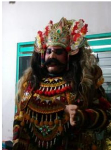
Gambar 2. Tokoh Minakjinggo dalam Kesenian Jinggoan/Janger