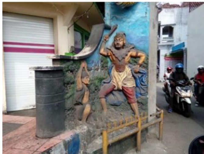
8. Mural di Jalan Sebelah Selatan Puskesmas Kabat