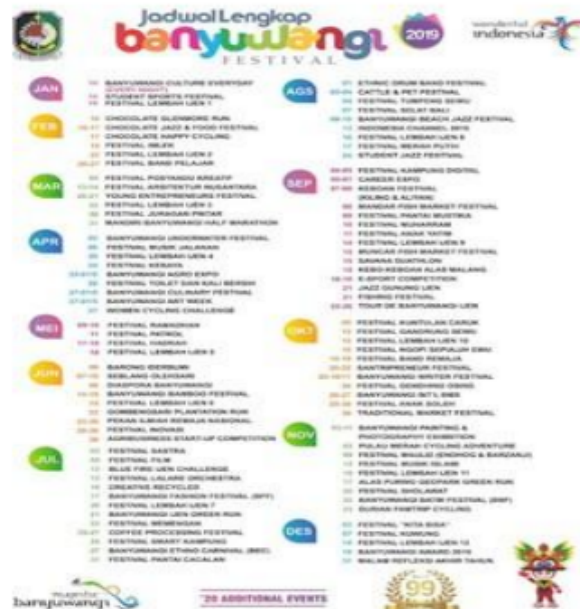
Gambar 1. Jadwal Banyuwangi Festival 2019

banyak macam seni dan budaya baik tradisional maupun modern. Semua seni dan budaya yang ada di Banyuwangi dijaga dan dilestarikan oleh pemilikinya.