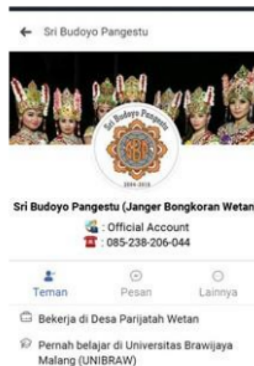
Gambar 3. Akun Media Sosial Grup Janger Sri Budoyo Pangestu